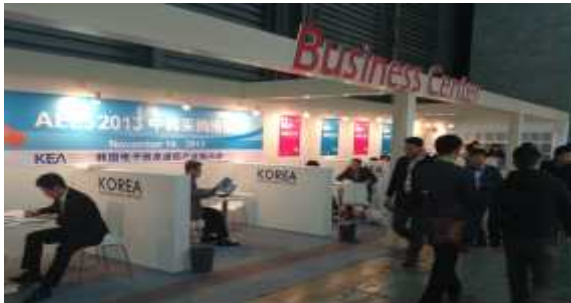
< 한중 Sales Fair >