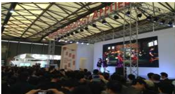
< 한류 공연 >