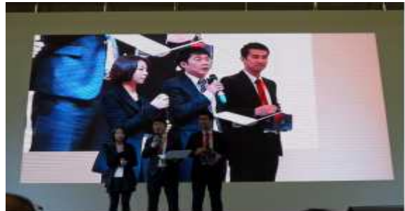
< 제품시연회 >