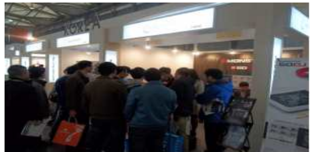
< 한국관 전경 >