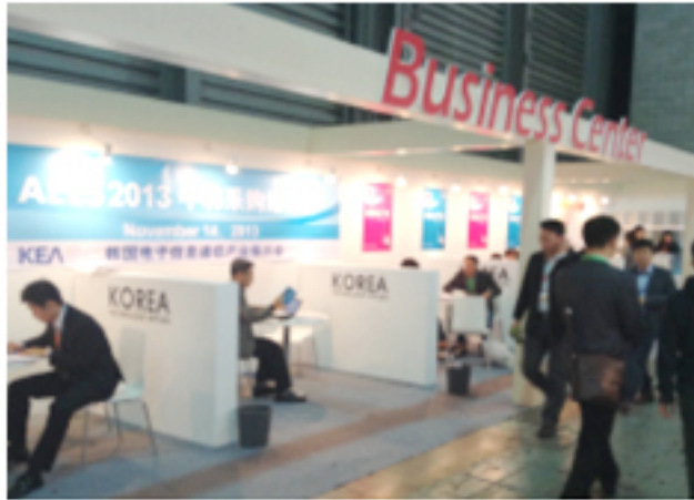
한중 Sales Fair

* 현지 파트너십을 통한 중국 전자IT 분야 진성바이어 섭외, 현장상담을 위한 1:1 비즈니스 상담회 동시 진행